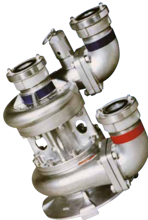
Pompa turbimat TU 65 LM